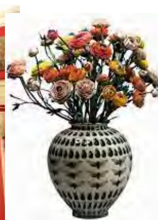
Un'opera di Bertozzi & Casoni