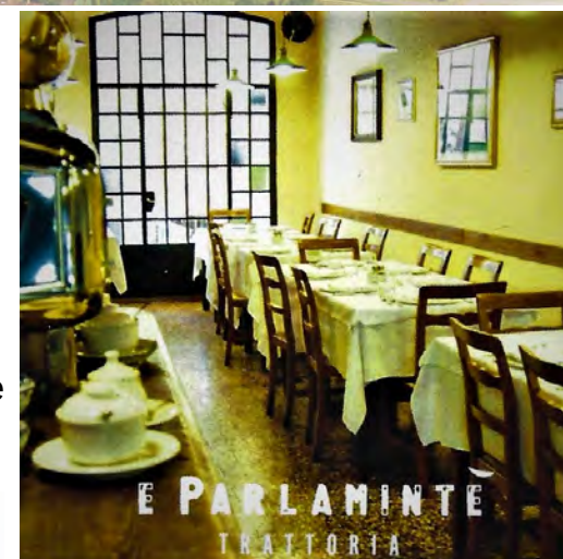
E PARLAMINTÈ TRATTORIA