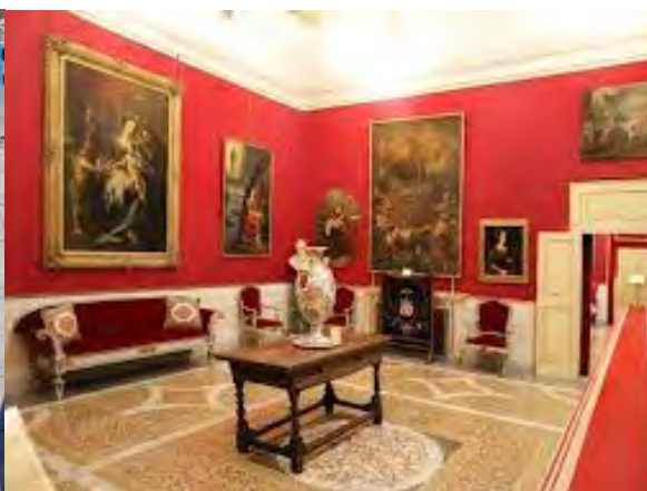
Una sala di ricevimento di Papa Pio VII