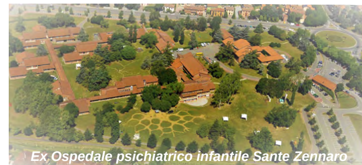
Ex Ospedale psichiatrico infantile Santa Zennaro

(Eventuali intolleranze alimentari o diete speciali, comunicarle all'atto dell'iscrizione)