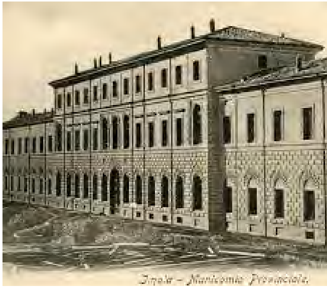
Imola - Manicomio Provinciale.