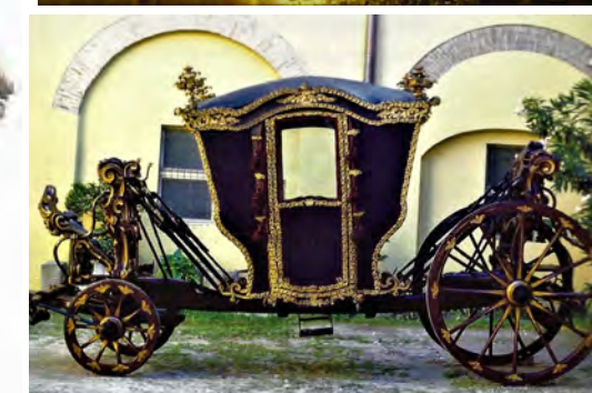
Carrozza della Madonna del Piratello